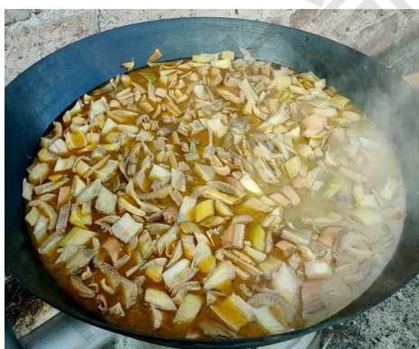
图4 地涌金莲煮羊肉