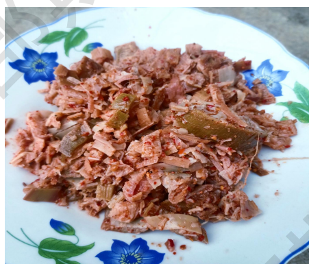
图2 腌制的地涌金莲做菜